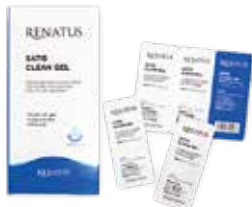
1箱20包入りの除菌ジェル

今後はさらにクレモールの商品ラインナップが充実予定！ぜひ一度、のぞいてみてはいかがでしょうか。