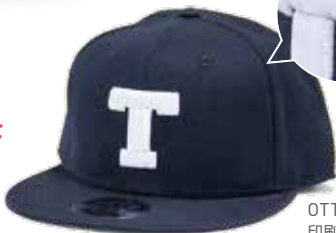
OTTOキャップ 印刷方法：3D刺繍 ¥7,600～/1個