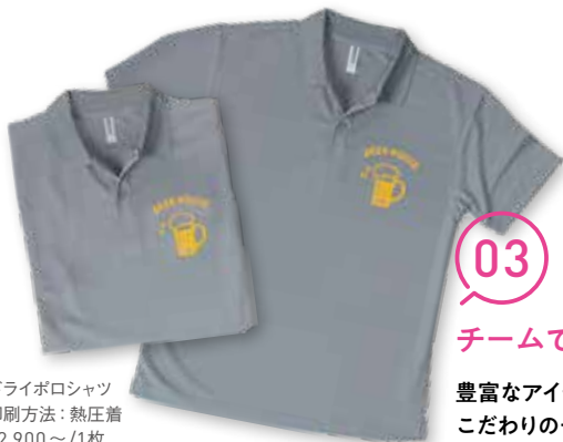
ドライポロシャツ 印刷方法：熱圧着 ¥2,900～/1枚