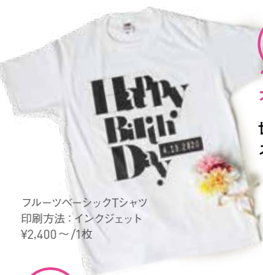
フルーツベアシックTシャツ 印刷方法：インクジェット ¥2,400～/1枚