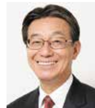
元リッツ・カールトン 日本支社長 人とホスピタリティ 研究所代表

IT・AI・ロボット社会などと向き合う際の人間力とはなにかを探る機会になればと思います。