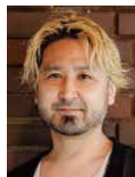
株式会社スイッチ 代表取締役

WEB申込みはこちらから ▶ https://www.vanfu.co.jp/seminar/