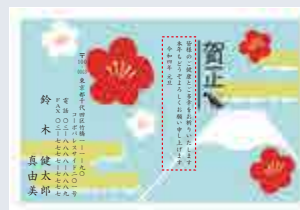
252 添書き・書体変更不可