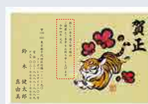
249 添書き・書体変更不可