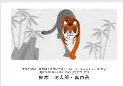
243 添書き・書体変更不可