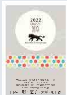
242 添書き・書体変更不可