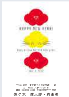
241 添書き・書体変更不可