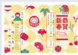
251 添書き・書体変更不可