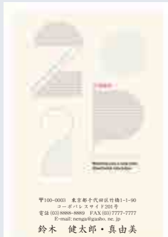
235 添書き・書体変更不可