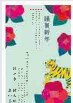
236 添書き・書体変更不可