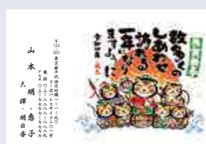
248 添書き・書体変更不可