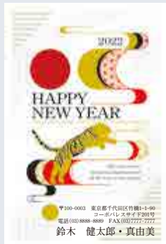
212 添書き・書体変更不可