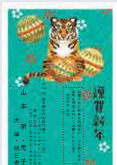
238 添書き・書体変更不可