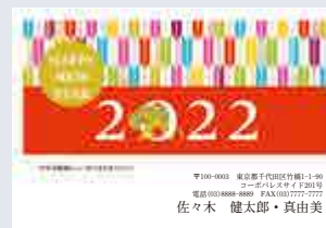
253 添書き・書体変更不可