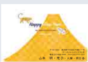
246 添書き・書体変更不可