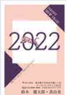
233 添書き・書体変更不可