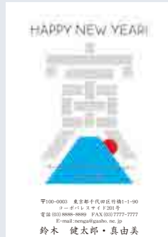
237 添書き・書体変更不可