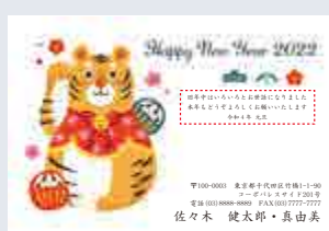
247 添書き・書体変更不可