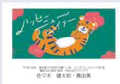
244 添書き・書体変更不可