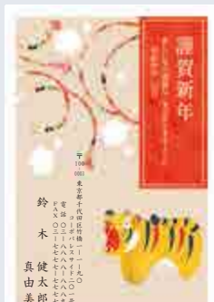
239 添書き・書体変更不可