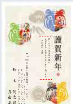
240 添書き・書体変更不可