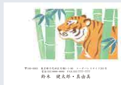
245 添書き・書体変更不可