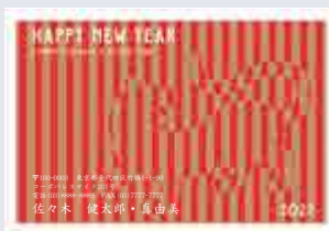
250 添書き・書体変更不可