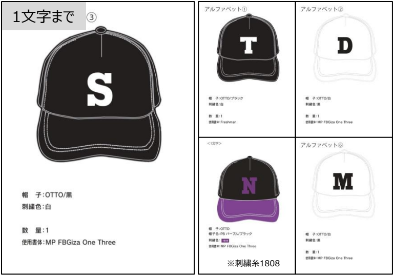
OTTO①-イニシャル-書体FBGizaOneThree (大)