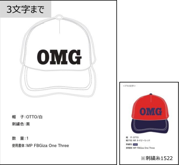
OTTO④-3文字(OMG) 書体FBGizaOneThree (大)