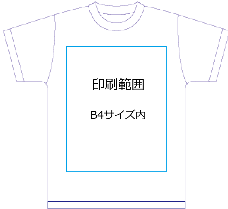
プリント位置指定例