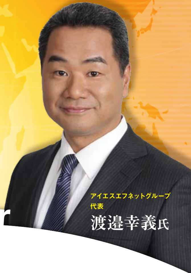
アイエスエフネットグループ 代表